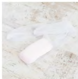
帯枕 (ガーゼをかけておく)